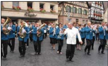
A Tótkomlói Ifjúsági Fúvószenekar felvonulása Neunkirchenben