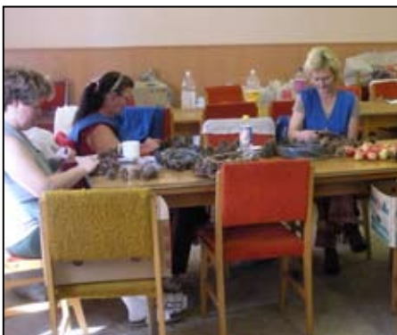
A szociális foglalkoztatottak nagy odafigyeléssel végzik munkájukat

Hosszú idő volt mire eljutottak a munka kezdés időpontjához. Az első munkavállalók már 2007. májusában jelentkeztek dolgozni. Ők 2008. januárjától dolgoznak 3 fő foglalkoztatási segítővel és egy koordinátorral. Hogy idáig eljuthattunk az Tótkomlós Város polgármesterének, dr. Sztakó Józsefnek, Takács Ferenc alpolgármesternek és a Képviselő-testület tagjainak köszönhető, akik támogatták ennek a foglalkoztatási formának a létre-