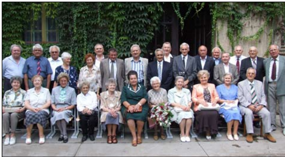
Komlói és a környékről „bejáró” ’48-asok, akik még örülhettek a találkozásnak.