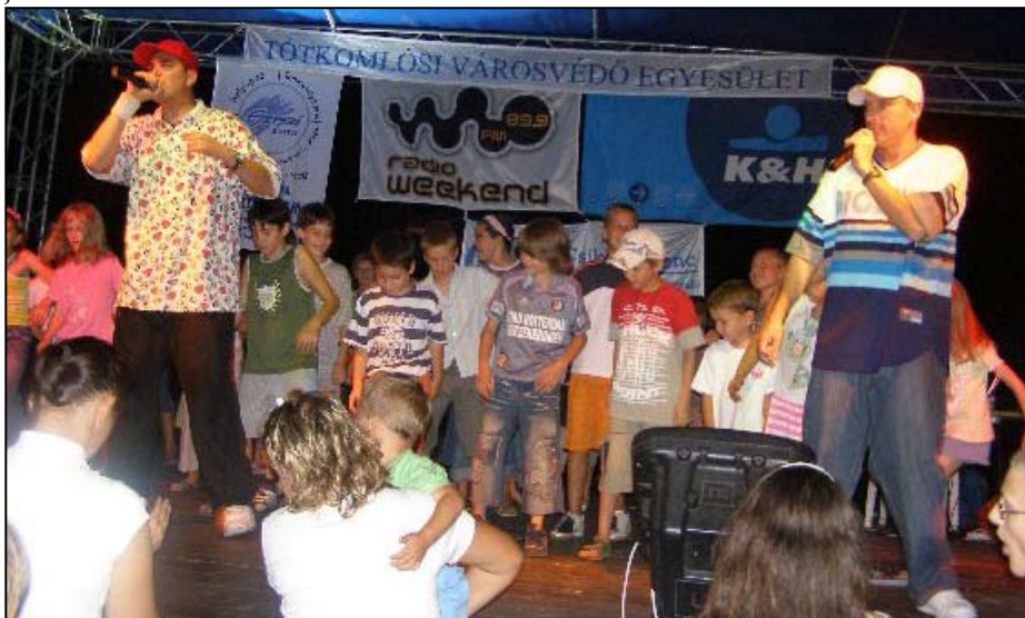
Az Animal Cannibals megtáncoltatta a gyerekeket is