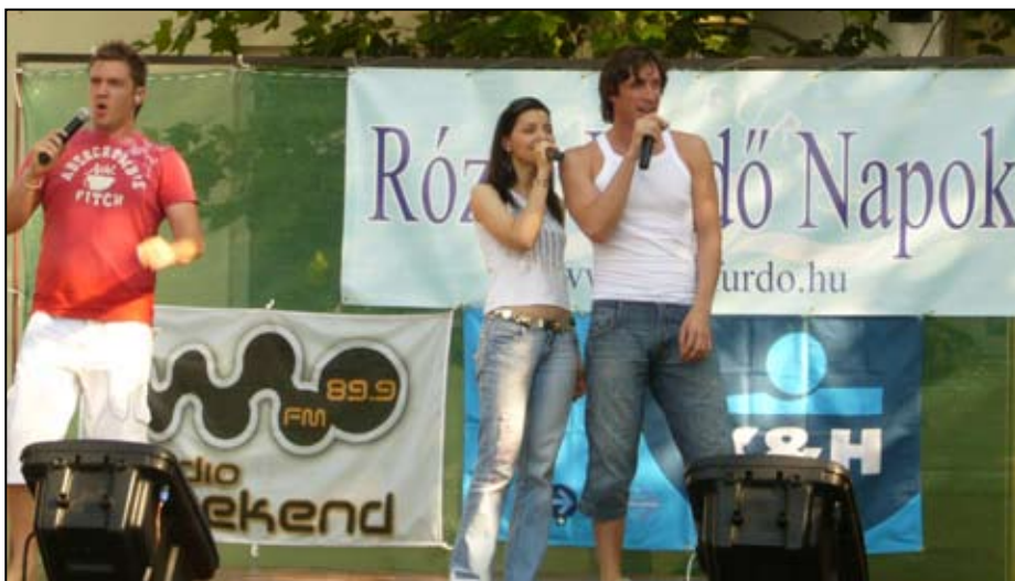
A Crystal együttes nagyon jó hangulatot teremtett

Ezen a nyáron is megrendezték a Rózsafürdő Napokat, július 12-13-án, természetesen a Rózsafürdőben. Az időjárás nagyon kegyes volt a szervezőkhöz és a strandolni vágyókhöz is, hiszen legalább 35 fokot mutatott a hőmérő mind a két napon. Természetesen a jó időnek köszönhető, hogy mindkét napon több százan látogattak el városunk fürdőjébe, tótkomlóiak és vidékiek egyaránt.