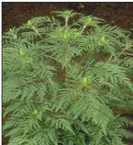
Gátoljuk meg a parlagfű elterjedését

A parlagfűvel kapcsolatos védekezési munkákat legkésőbb június 30-ig el kell végezni. Július 1-jétől az eljáró hatóság mérlegelés nélkül köteles eljárást indítani a mulasztások kapcsán. Mivel a parlagfű virágzása kb. szeptember végéig figyelhető meg, a védekezési munkákat egészen őszig kell végezni.