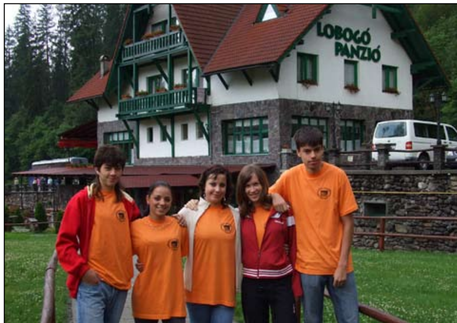
A Lobogó Panzió csodálatos környezetében remekül érezték magukat a gyerekek