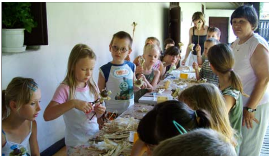
A kézművestáborban kiderült milyen ügyesek és kreatívak a gyerekek

A nyár hátralévő részére kellemes pihenést kívánunk minden táborvezetőnek és diáknak!